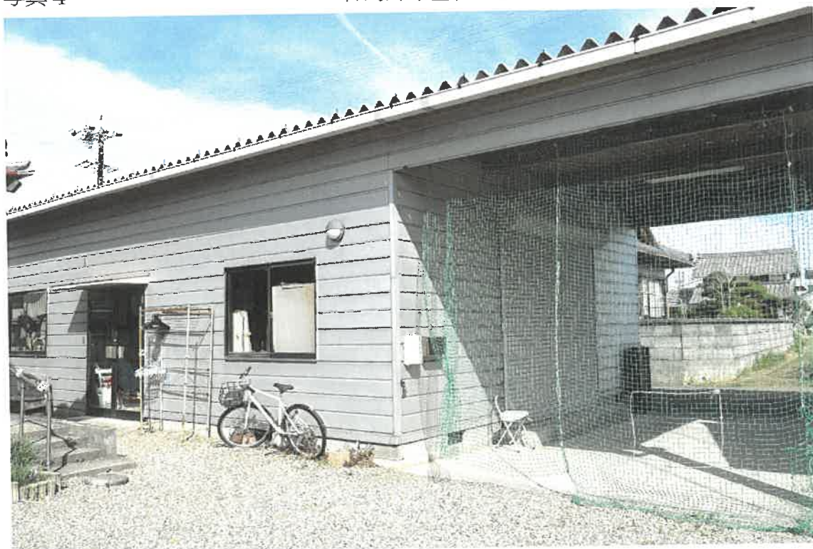
目的外未登記建物2