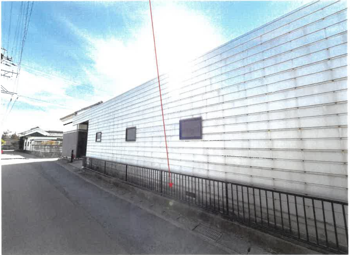
目的物件の現況写真