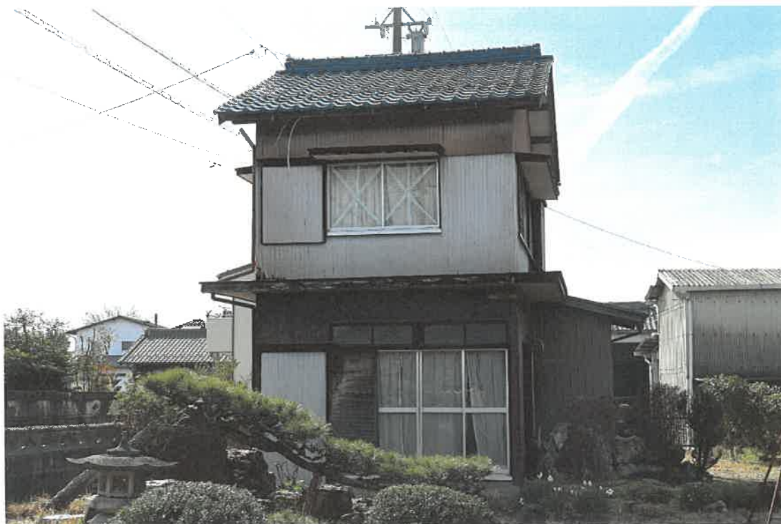
目的外未登記建物4