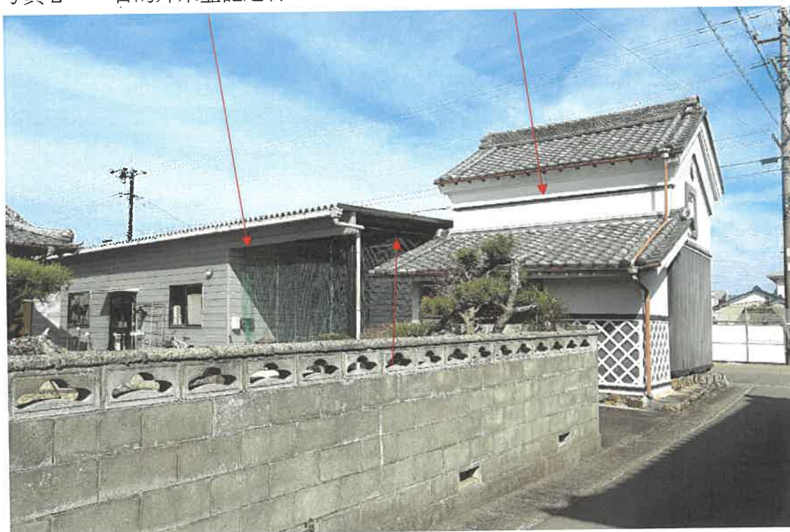
目的外未登記建物3