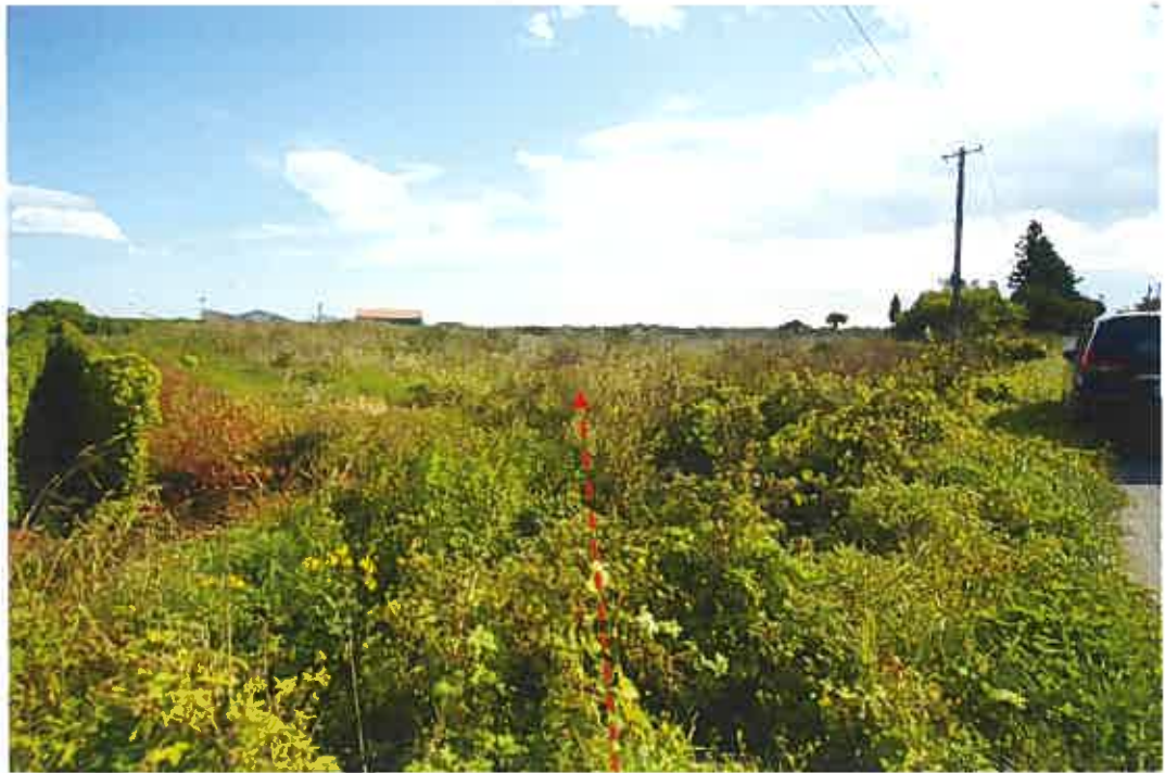
物件 6 2, 6 3 土地