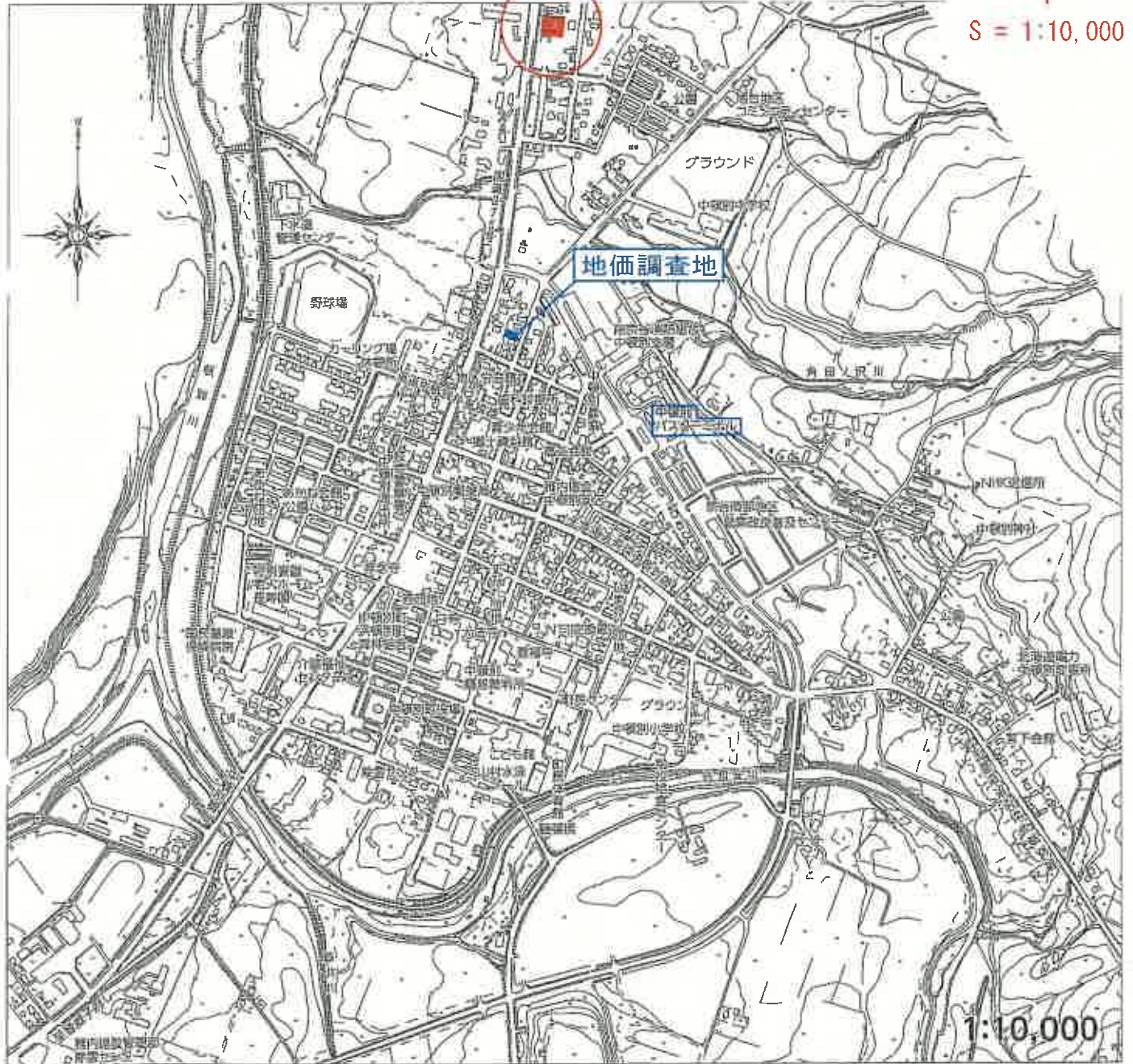
中頓別町役場 市街地白図