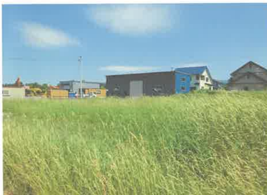
本件土地の形状、目的外建物