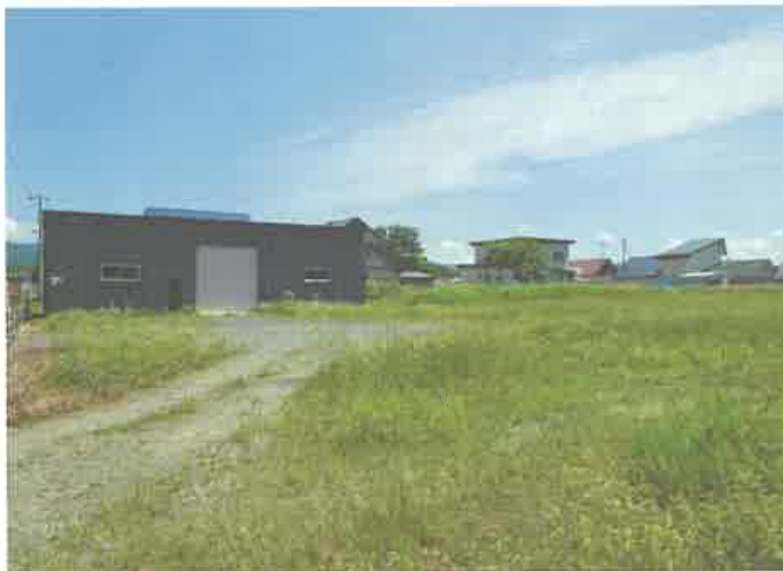
本件土地の形状、目的外建物